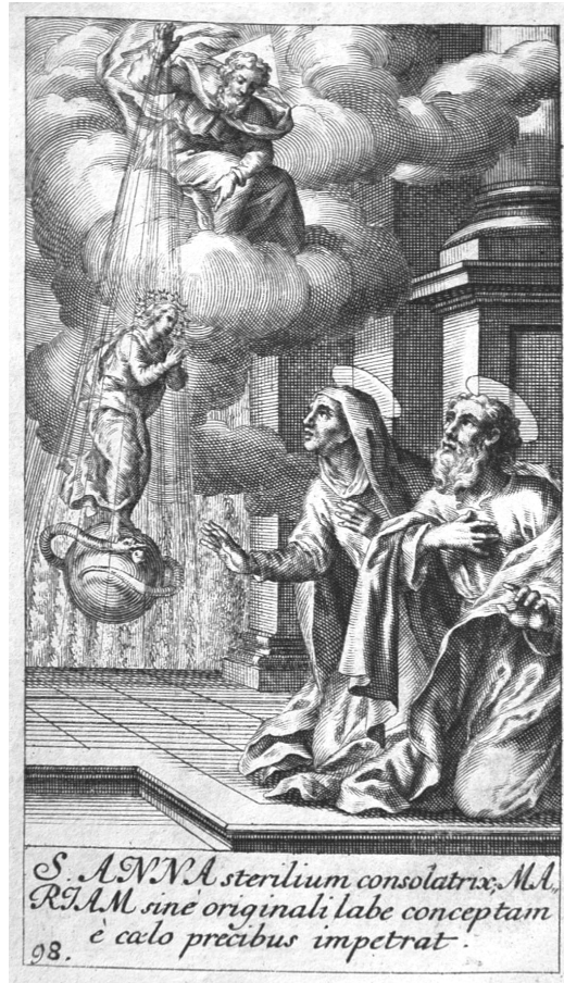
Szent Anna az imádság által az hosszú üdöig tartó magtalanságtul megmenekedik