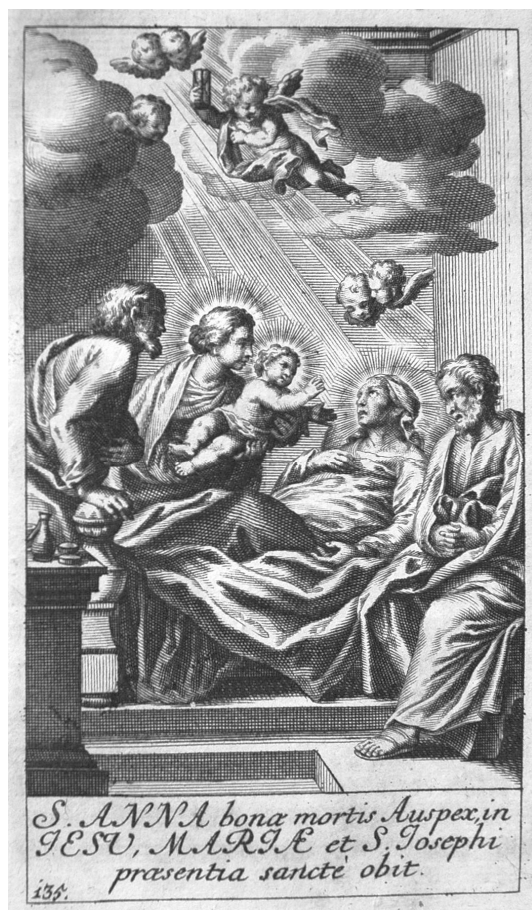
A Szent Anna szentséges haláláról