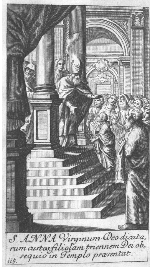
A Szent Anna Máriát a templomban fölviszi, és Mária az Istennek örökös szüzességet fogad