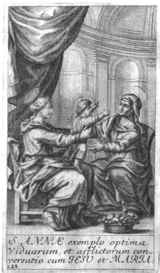
A Szent Annának Jézus és Máriával való öröme az ő özvegységében