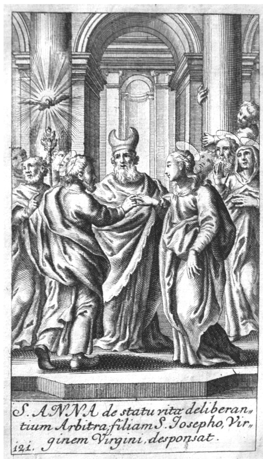
A Szent Anna az ő legtisztaságosb szűz leányát eljegyzé Józsefnek