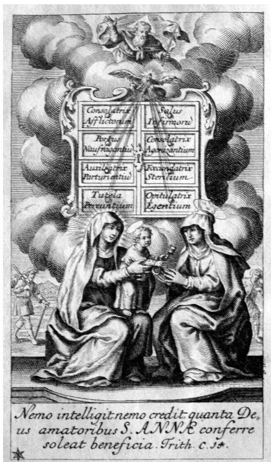
A Szent Annát szeretőket pártfogolja az Úristen

— — — — — Az Isten mindenhatóságának tárháza (Bécs, 1708) Metszet a címlap előtt