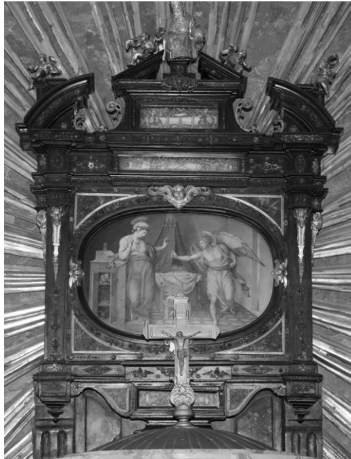
Házioltár az Angyali üdvözlés jelenetével. Kalocsa, érseki palota kápolnája