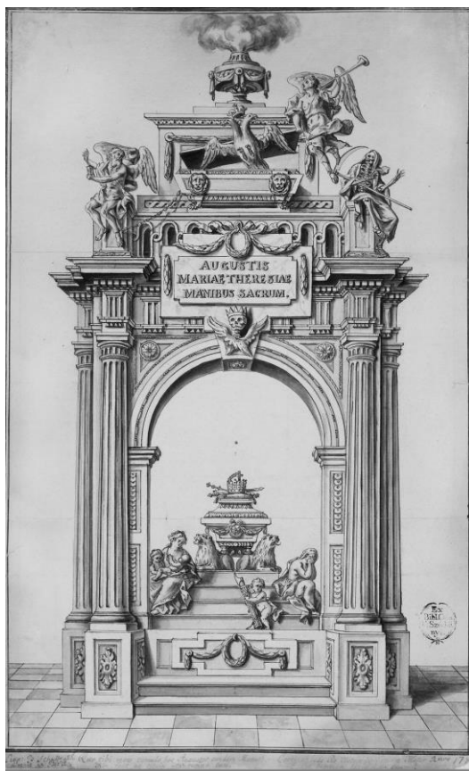
A castrum doloris főnézetének terve (MNM TKCS, 3280 lsz.)

Schaffrath tusrajzainak tanúsága szerint a gyászépítmény egy négyzet alaprajzú, mind a négy oldalán egy-egy íves árkáddal megnyitott pavilon volt, amelynek felületét klasszicizáló építészeti elemek tagolták. A pavilon közepén, lépcsős emelvényen helyezkedett el a királynő oroszlánok által tartott ravatala. A koporsó tetején keresztbe fektetett kardon és jogaron a német-római császári, valamint a magyar és cseh királyi korona stilizált másolata kapott helyet. Az építmény elülső oldalán, a lépcsőn balra a Szeretet allegorikus nőalakja ült karján két gyermekkel, jobbra pedig az Igazságosság zokogó alakja ült, arcát tenyerébe temetve.