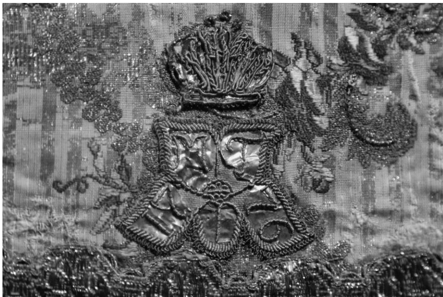
Mária Terézia monogramja az 1776-ban a székesfehérvári székesegyháznak adományozott miserubán

dékozott a királynő. Ez utóbbi színes selyemfonallal hímzett díszítése teljesen azonos a bécsi Hofburgkapelléből származó, 1778-ban készült Seidenschmuck-Ornat mustrájával, 44 ami jól érzékelteti, hogy az 1770-es években szinte sorozatgyártásban készültek a kazulák a bécsi udvar megrendelésére.