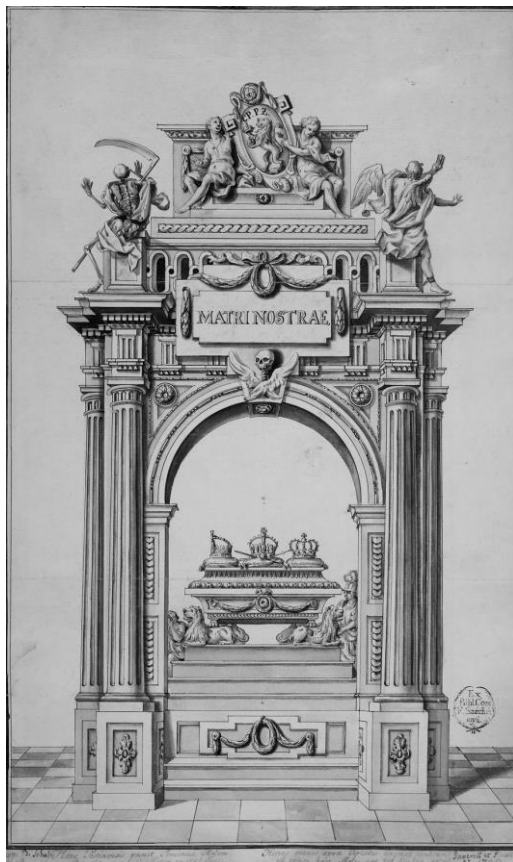
A castrum doloris jobboldali nézetének terve (MNM TKCS, 3281 ltsz.)

A castrum doloris hátsó oldalán, a lépcsőn balra az Okosság sarkalatos erényét jelképező Minerva ült, kezében karddal, térdénél pajzzsal, míg vele szemközt a Hit lefátyolozott, könyvet tartó nőalakja kapott helyet. Fölöttük a homlokzaton a Matri Regum felirat volt olvasható, míg az építmény tetején a szarkofágból királyi és hercegi koronák szállnak fel, mintegy illusztrálva az epigramma egyik sorát ( Non facit ad titulos ista rapina tuos – Nem ragadja el a címeidet [ti. a halál]). A forrásokból nem derül ki egyértelműen, hogy Zimányi epigrammái hol kaptak helyet az építményen, ám az