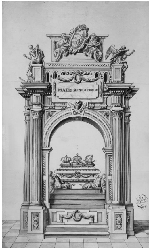
A castrum doloris baloldali nézetének terve (MNM TKCS, 3282 ltsz.)

A gyászépítmény bal oldali homlokzatán Matri Hungarorum felirat fölött a magyar címer, a jobboldalon a Matri Nostrae felirat fölött Pest megye címere volt látható: a koronát és országmát tartó kétfarkú oroszlán fölött a vármegye nevének (Comitatus Pest, Pilis et Zolth) kezdőbetűi (C.P.P.Z.) kaptak helyet.