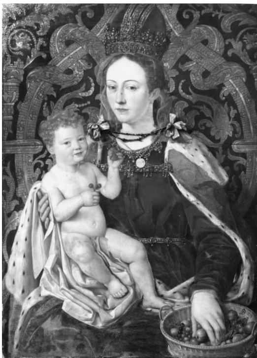
Ismeretlen németalföldi mester: Szűz Mária a gyermek Jézussal, 1550 k.