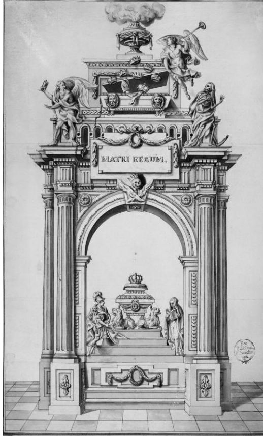
A castrum doloris hátoldalának terve (MNM TKCS, 3283 ltsz.)

analógiák alapján valószínűsíthető, hogy középen, az oroszlánok által tartott koporsón voltak olvashatók a verssorok. 19