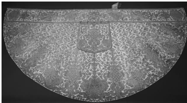
Mária Terézia koronázási díszruhájából Erdődy Gábor egri püspök számára készült pluviálé, Egri Érseki Palota és Látogatóközpont

A királynő kívánságának megfelelően Erdődy püspök Mária Terézia koronázási díszruháját főpapi ornátussá alakíttatta át, amely pluviáléból, miseruhából, mitrából, stólaból, manipulusból és kehelytakaróból áll. Az együttesből a pluviálé és a mitra máig fennmaradt az egri egyházmegyei múzeum gyűjteményében, 17 míg az ornátushoz tartozó miseruhát és stólát a szatmárnémeti székesegyház kincstára őrzi. 18 A palástos és a kazulán az 1741-