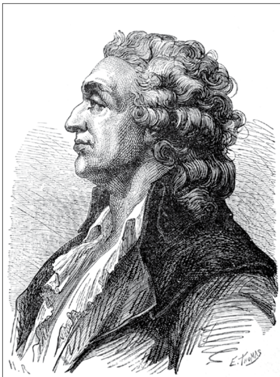
Nicolas de Condorcet 26

Másrészt a népi közvetlen hatalomgyakorlás is az ösgyűlések keretében történik. Ennek kapcsán három intézmény említendő. Az ösgyűlésben tömörült polgárok egyrészt jogosultak arra, hogy a Törvényhozó Testület által elfogadott törvényekkel szemben vétót emeljenek. Ez a népi vétó a fakultatív referendum elődje, s gyakorlásá-