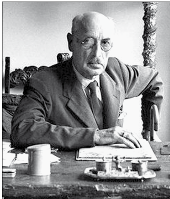
Károlyi Mihály 7

Felszólalásának jelentős része a fent említett témán túl elsősorban annak bizonyítására irányult, hogy „ Magyarországon soha nem volt parlamentarizmus ”, 19 valamint arra, hogy az ország ideiglenes államfője egy diktátor, aki nem tartotta be a Sir George Clerk brit diplomatával 20 kötött megállapodást, mely szerint – Károlyi előadását alapul véve – a törvények betartása és a demokratikus intézmények megalakítása esetén az antanthatalmak el fogják ismerni az új magyar kormányt. 21 Ezt az okfejtést azonban a korszak neves alkotmányjogászai több alkalommal is megcáfolták, bizonyítva a hatalommegosztás tanának 22 érvényesülését a hatalmi ágak között. A proletárdiktatúra bukását követően ugyanis a politikai közélet elsődleges célja a jogfolytonosság és a történelmi alkotmány visszaállítása volt, amit a külső körülményekre tekintettel, ideiglenes intézményekkel biztosítottak. Először a Friedrich István-féle választójogi rendelet alapján