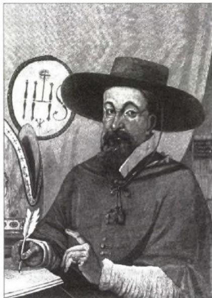
Pázmány Péter bíboros, esztergomi érsek