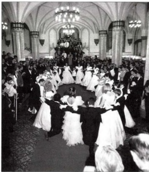
Felvétel az 1998-as gólyabálról