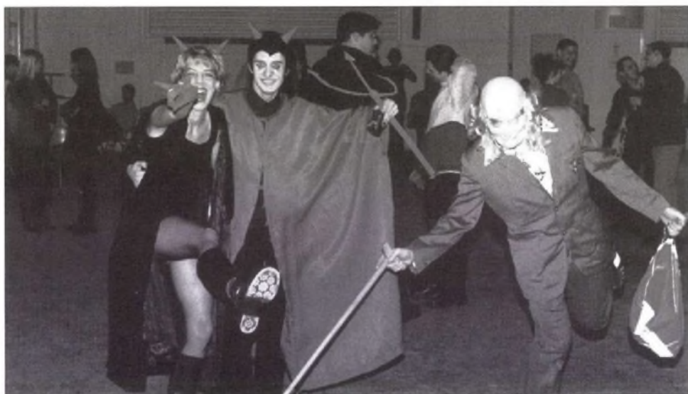
Farsangi összejövetel az elsős előadóban (1999)