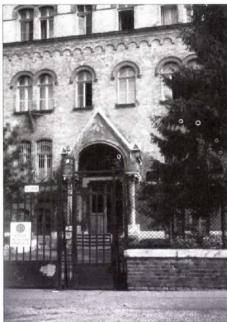
Az apácázárda bejárata a budapesti Ménesi úton, ahol az 1995/96-os tanévben a jogi kar működött