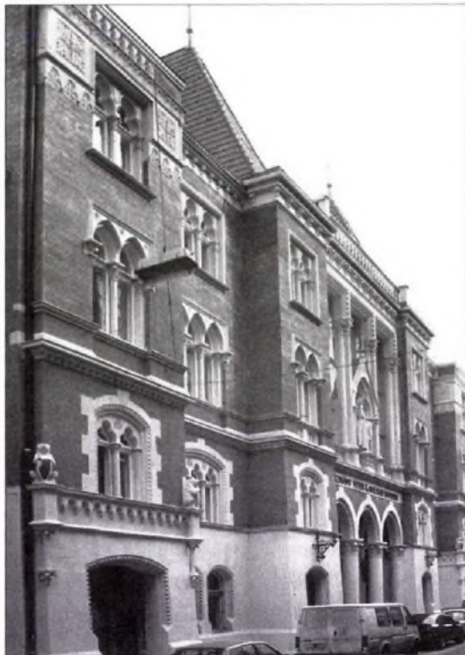
A kar felújított épülete 1999-ben