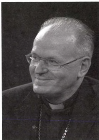
Dr. Erdő Péter