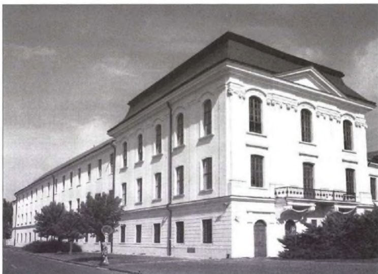
A Pázmány Péter által 1635-ben alapított egyetem főépülete Nagyszombatban