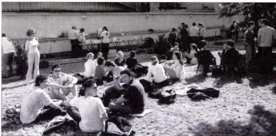
Mulatság a kar kertjében (2004)