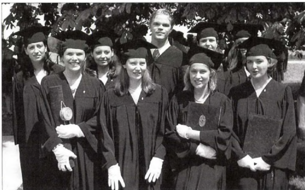
Csoportkép a frissen megszerzett diplomával (2002)