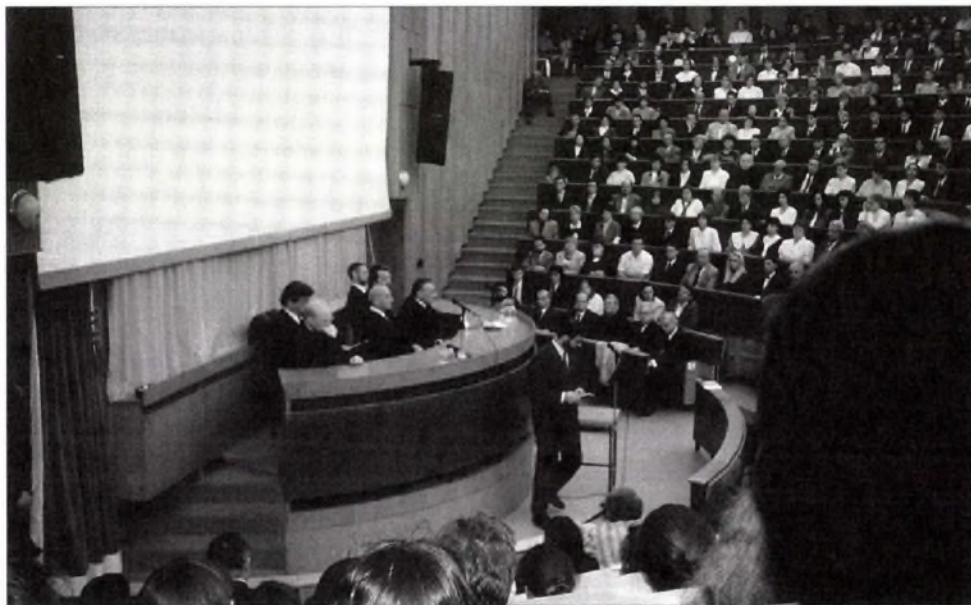
Az első tanévnyitó a Villányi úti konferencia-központban, 1995 szeptemberében