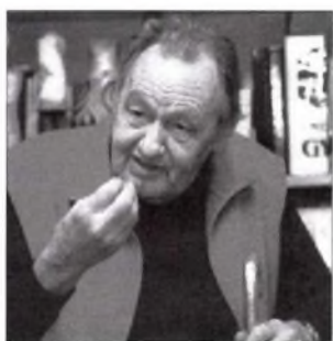
Pálinkás György (2004, posztumusz)