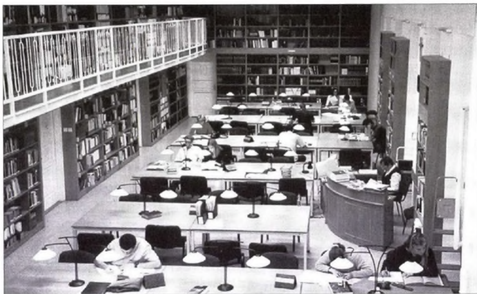
Elmélyült tanulás a kari könyvtárban (2004)