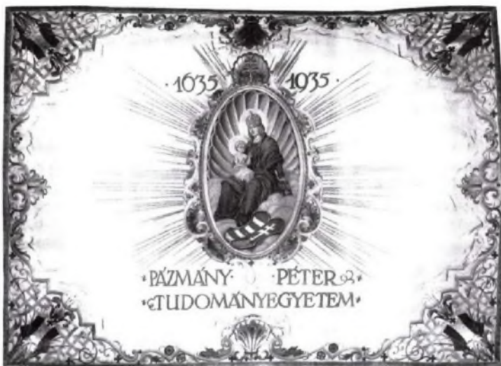
Az egyetem alapításának 300. évfordulójára készült jubileumi díszszászló

Az 1920-as években Klebelsberg Kunó minisztersége idején az oktatást stratégiai kérdésként kezelték, a Trianonban meggyengült ország minden erejét arra összpontosította, hogy bemutassa a világnak a magyarság európai műveltségét. Jelentős összegeket fordítottak ösztöndíjakra és a külföldi kulturális kapcsolatok ápolására. Az 1930-as évek átlagosan 6000 hallgatójának egyébként közel egyharmada volt jogász.