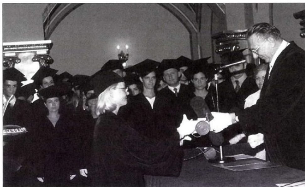
Az első diplomaosztó a Pázmány jogi karán (2000. június)