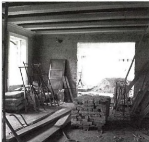
Egyetemi előadó kezdeti stádiumban (1997)