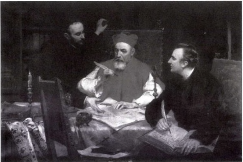
Pázmány Péter megalapítja az egyetemet. Temple János festménye (1885)