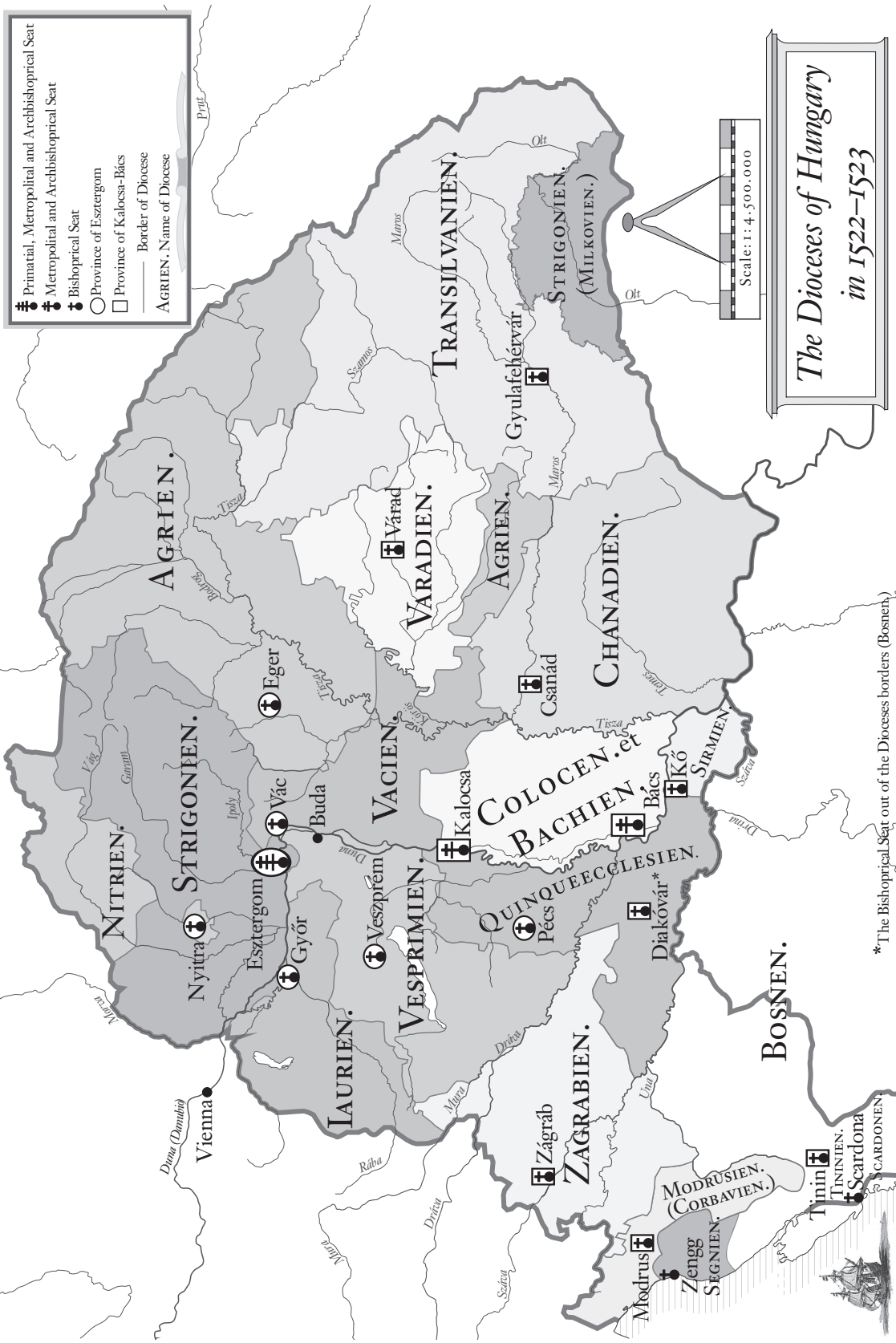
The Dioceses of Hungary in 1522–1523