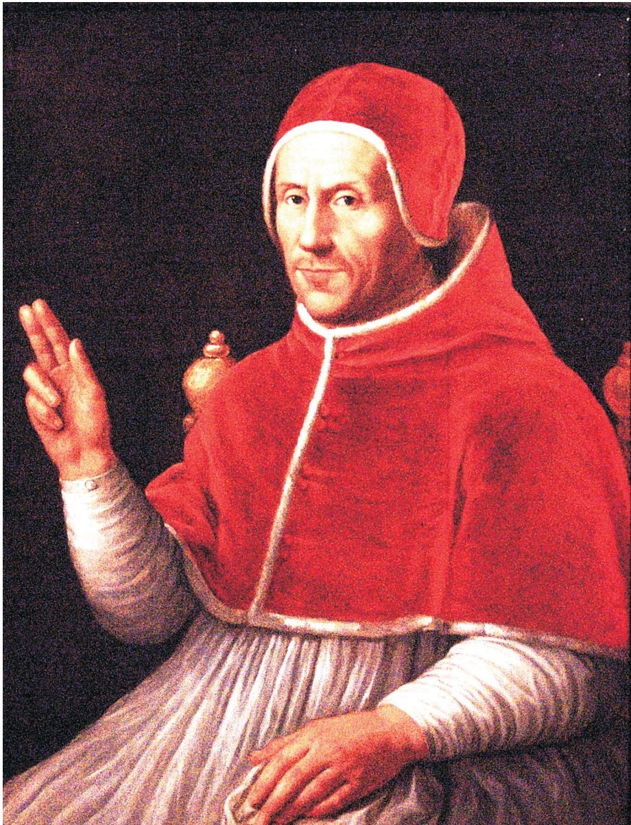
VI. Adorján pápa (1522–1523)