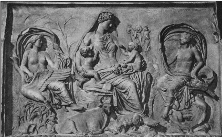
1. kép. Az Ara pacis Augustae Földanya-ábrázolása

A rómaiaknál azonban a táplálékkal és az étellemezzel, valamint a földműveléssel, és az anyagi értelemben vett bőség megteremtésével kapcsolatos feladatok a görög Démétér istennő római megfelelőjének, a gabonaistennő Ceresnek jutottak. (Démétér egyúttal Plútosz, a gazdagság istenének szülőanyja.) A föld megművelése és a szántás, az önként termő föld képzete (Tellus) a rómaiak gondolkodásában összekapcsolódott, és részben össze is olvadt Ceres és a boldog aranykor mítoszával, valamint az ősi, romlatlan állapotok szimbolikájával, amit elsősorban a Kr. e. 13–9. között épült augustusi békeoltár ( Ara Pacis Augustae ) gabonával megrakott, gyermekekkel körülvelt Tellus ábrázolásán lehet megfigyelni. A római termékenységistenek alakjához is kapcsolódó múltbeli val-